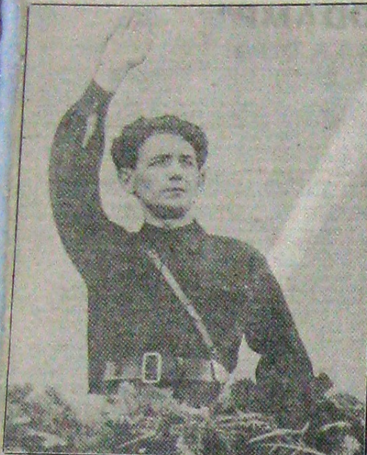
HORIA SIMA Comandantul Mișcării Legionare